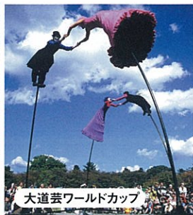
大道芸ワールドカップ