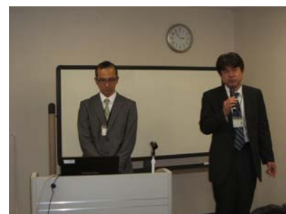
写真右:新村支店長