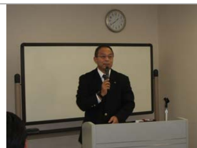
写真:山下裕之事務局長