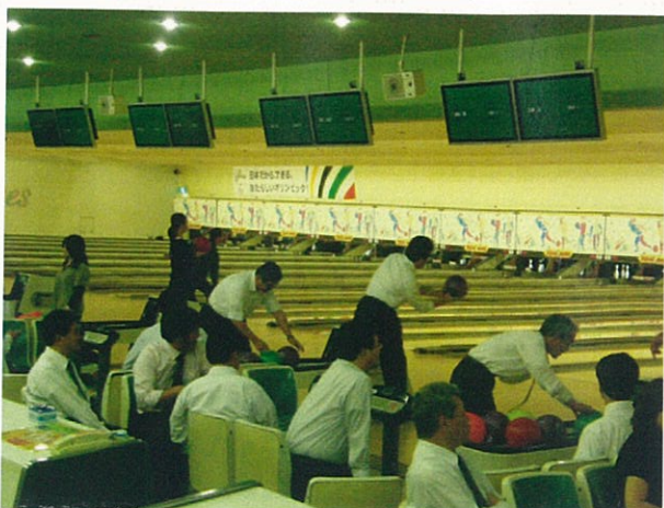
選手たちの一投一投に拍手と歓声も