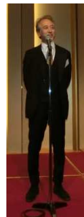
坂口副理事長 中締め挨拶▲