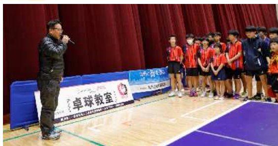
▲篠原研修広報副部会長 閉会挨拶