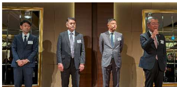
▲ 令和7年8月以降にご入会された新会員の皆様

令和7年12月9日 九住協忘年会がグランドハイアット福岡で開催され、86社139名が参加した。 終始和やかな雰囲気の中、会員の一層の団結力を誓い合う、大いに盛り上がった懇親の場となった。